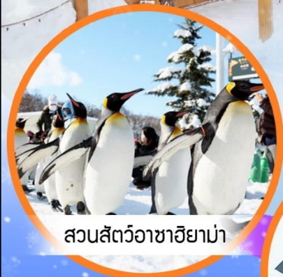
สวนสัตว์อาซาฮยาม่า

เที่ยวจุใจฮอกไกโด สัมผัสหิมะ เล่นสกี แช่ออนเซ็น | 5 วัน 3 คืน