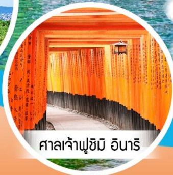
ศาลเจ้าฟูชิมิ อิฮาริ