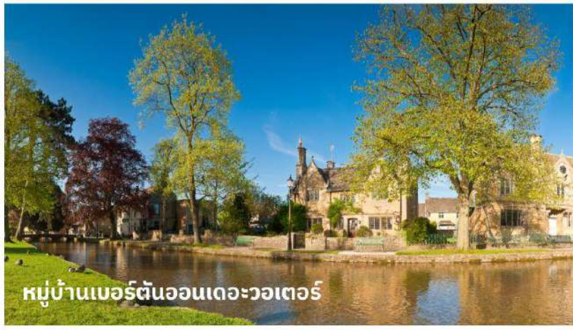
หมู่บ้านเบอร์ตันออนเดอะวอเตอร์