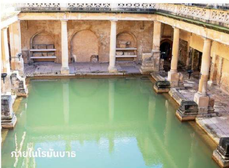
ภายในโรมันบาร