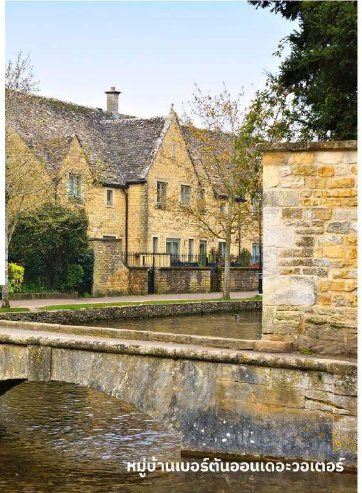
หมู่บ้านเบอร์ตันออนเดอะวอเตอร์

จากนั้นนำท่านเดินทางสู่ เขตคอตส์วอลส์ เขตหมู่บ้านชนบทแสนสวยของอังกฤษถึง 70 หมู่บ้าน ใช้เวลาเดินทางประมาณ 3.30 ชั่วโมง นำท่านเที่ยวชม หมู่บ้านเบอร์ตันออนเดอะวอเตอร์ (Bourton On The Water) หมู่บ้านเล็ก ๆ ที่รู้จักกันในนามของ “เวนิส แห่งคอตวอลส์” เมืองที่โด่งดังที่สุดในคอตส์วอลส์ ดูเจียบสงบบมีลำธารสายเล็ก ๆ (แม่น้ำวินด์ริช) ไหลผ่านกลางเมือง และมีสะพานหินทอดข้ามน้ำเป็นช่วง ๆ กับต้นวิลโลว์ที่แกว่งกิ่งก้านใบอยู่ริมน้ำ