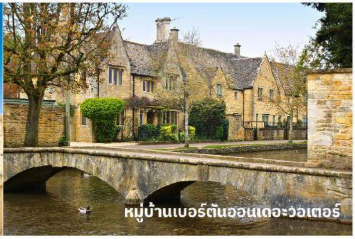
หมู่บ้านเบอร์ตันออนเดอะวอเตอร์