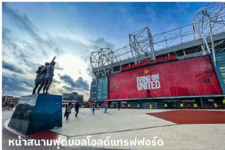
หน้าสนามฟุตบอลโอลด์แทรฟฟอร์ด