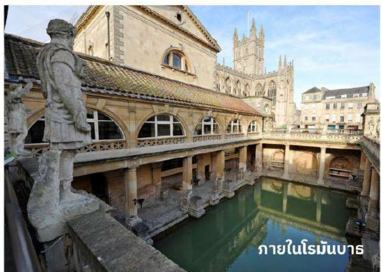
ภายในโรมันบาร