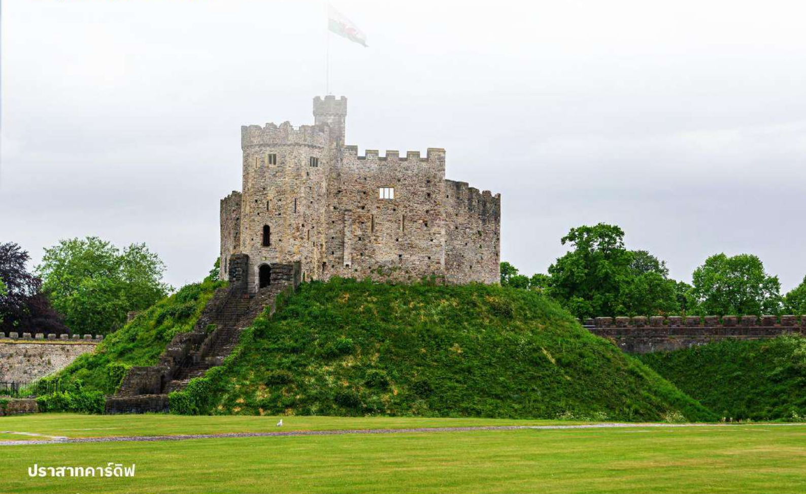
ปราสาทคาร์ดิฟฟ์

บริการอาหารค่ำ ณ ภัตตาคาร นำท่านเข้าสู่ที่พัก Clayton Hotel Cardiff หรือเทียบเท่า