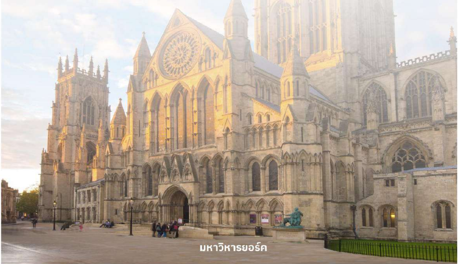
มหาวิหารยอร์ก

จากนั้นนำท่านเดินต่อไปที่ The Shambles (เดอะแซมเบิล) เป็นสถานที่ที่มีความคล้ายกับตรอกไดอากอนในภาพยนตร์ชื่อดังอย่าง Harry Potter อีสาระให้ท่านเดินเลือกซื้อของที่ระลึกตามอัธยาศัย