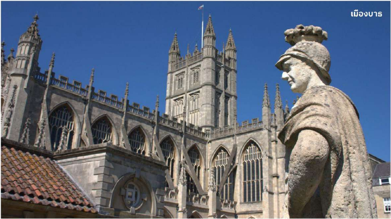
เมืองบาร

หลังจากนั้นนำท่านเดินทางสู่ เมืองบาร ดินแดนแห่งอาณาจักรโรมันอันยิ่งใหญ่บนเกาะอังกฤษเมื่อกว่า 2,000 ปีมาแล้ว ใช้เวลาเดินทางประมาณ 1.30 ชั่วโมง นำท่านเข้าชม โรงอาบน้ำแร่โรมัน ที่ชาวโรมันมาสร้างไว้เป็นสถานที่อาบน้ำแร่โดยอาศัยน้ำจากบ่อน้ำแร่ธรรมชาติที่จะมีน้ำไหลออกอย่างต่อเนื่องถึงวันละประมาณ 1,250,000 ลิตร และมีความร้อนถึง 46 องศาเซลเซียส ที่เมืองบารมี บ่อน้ำพุร้อนตามธรรมชาติ 3 แห่ง บ่อที่ใหญ่ที่สุดคือที่ ROMAN SACRED SPRING น้ำพุตกจากใต้ดินลึก 3,000 เมตร มีแร่ธาตุถึงกว่า 43 ชนิด