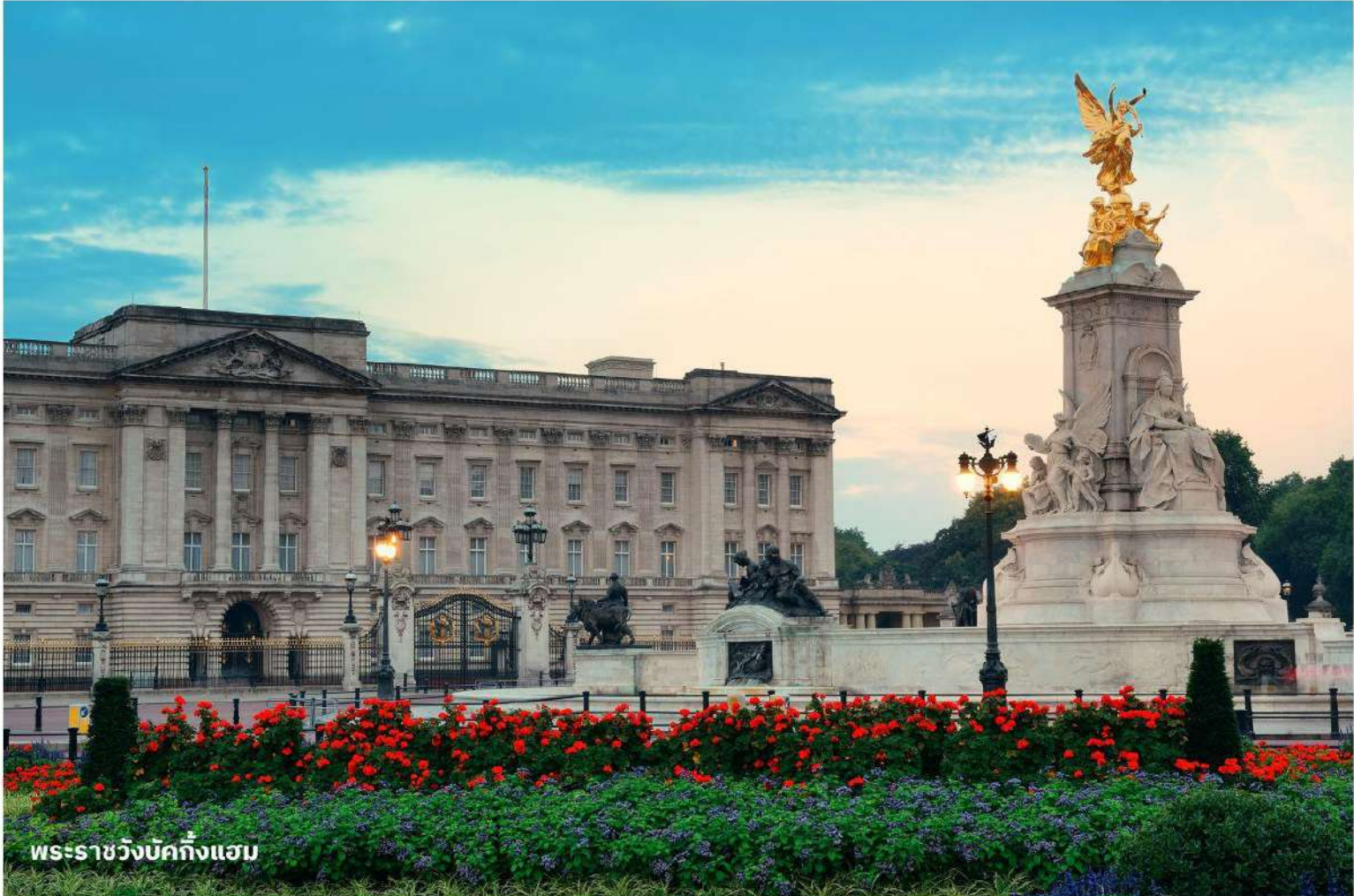
พระราชวังบักกิงแฮม

ได้เวลาอันสมควรนำท่านสู่สนามบิน เพื่อเตรียมตัวเดินทางกลับประเทศไทย