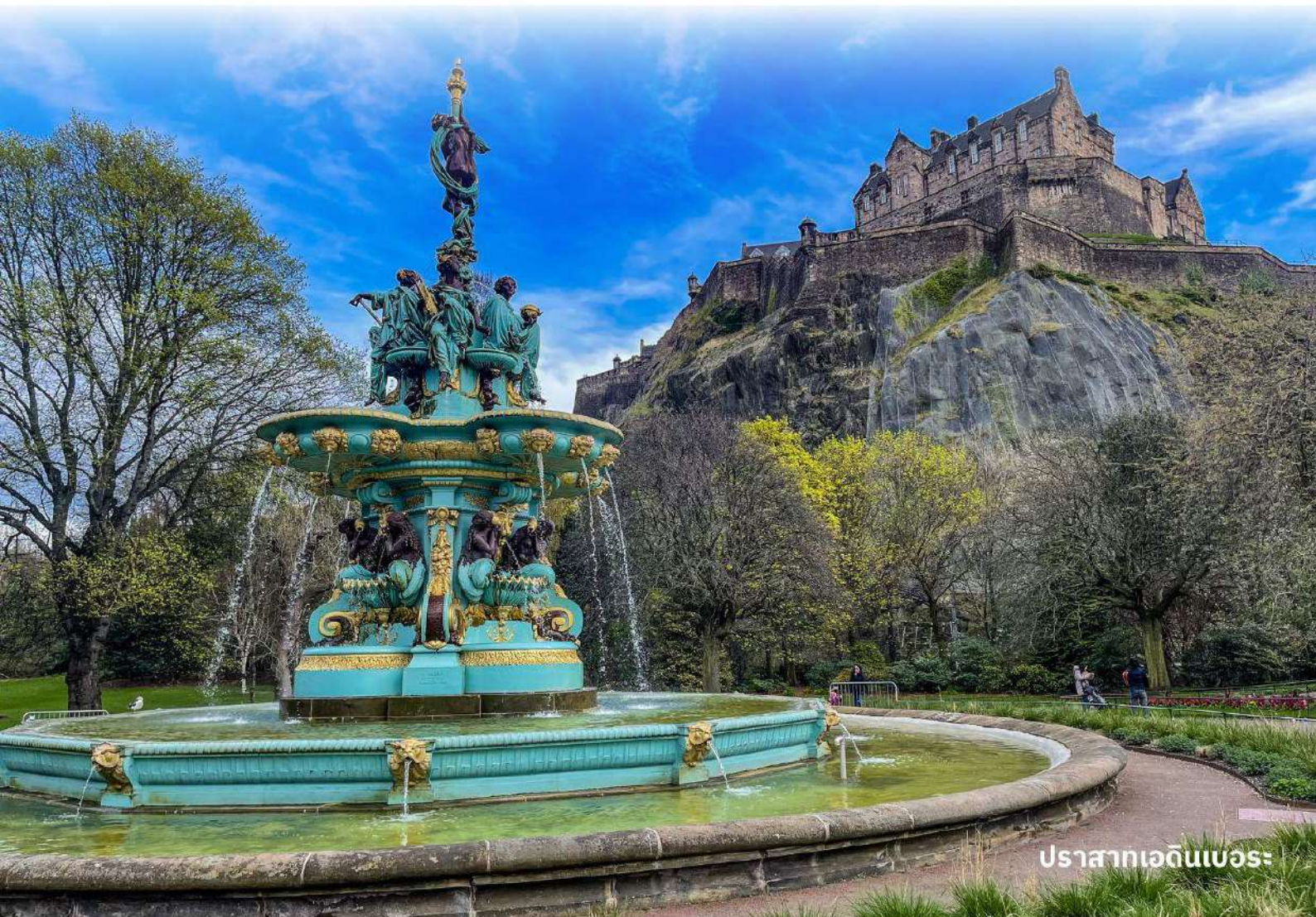
ปราสาทเอ็ดินเบอระ

ผังตรงข้ามเป็นรัฐสภาแห่งชาติสกอตอันน่าทึ่งด้วยสถาปัตยกรรมร่วมสมัย